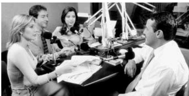
Emisora Javeriana Estéreo, Programa La Esquina De la FM

Durante 2001 se imprimieron, a través de las colecciones del Sello Editorial Javeriano - Notas del Profesor , Apoyo de Aprendizaje , Cuadernos Javerianos e Investigaciones y Ensayos -, un total de 54 textos, siete de los cuales fueron publicaciones nuevas. De otra parte, la Revista Universitas Xaveriana , medio de comunicación institucional dirigido a egresados javerianos y a personas que mantienen un vínculo cercano con la universidad, circuló en tres ediciones.