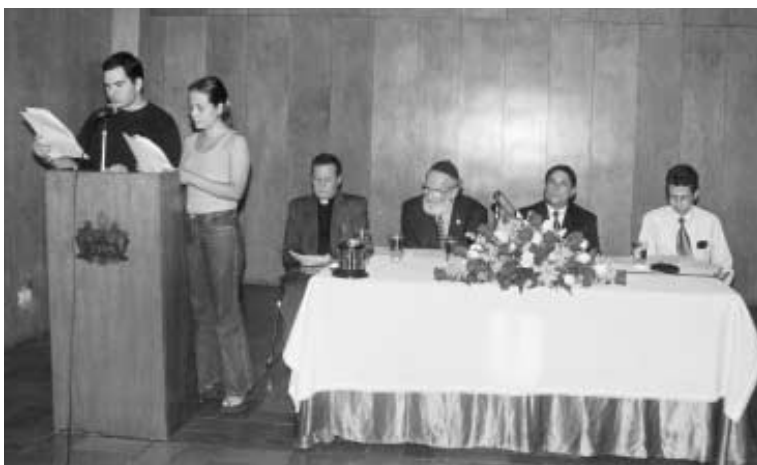
Oración Ecuménica por la Paz. Auditorio Central, Semana por la Paz 2001.